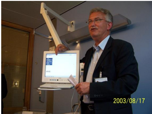
Figuur 4 ook in zelfredzaamheid is geïnvesteerd

Ook in zelfredzaamheid is geïnvesteerd. Ieder bed heeft een bedside terminal. Naast informatieuitwisseling en -verwerking voor medewerkers kan de patiënt via een touch screen maaltijden bestellen. De terminal bevat oproep-, entertainment- en domotica functies, zoals het bedienen van het licht, de deur en gordijnen.