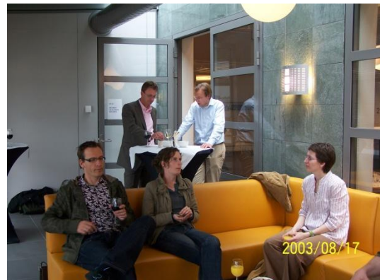
Figuur 9 even chillen en napraten

Het was een goede middag. Leuke ontmoetingen en een inspirerend verhaal. Jammer dat er nu zoveel negatieve publiciteit is rondom het financieel zwaar weer waarin het Orbis Medisch Centrum zit. Ik heb naar de inhoud mogen kijken, dat maakte de indruk van een goed doordacht en visionair plan. Zonder cijfers te kennen is het overduidelijk dat er een forse investering is gedaan in ontwikkelkosten en op gebied van automatisering en informatie- en communicatietechnologie.