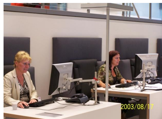
Figuur 7 informatie altijd en overal beschikbaar

U kunt zich voorstellen dat dit een hele andere manier van werken vraagt en discipline. Geen schaduwdoSSIERS. Altijd je werkblad netjes achterlaten. Er is dus amper papieren archief.