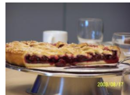
Figuur 1 Limburgse vla