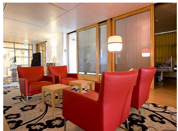
Figuur 3 healing environment

gerekend. Ofwel zij is erg 'poetserig' ofwel ik ben een smeerpoets, maar dat terzijde.